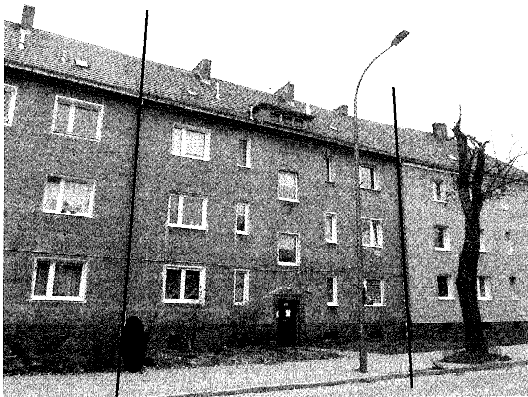
Fot.2. Oznaczono granice segmentu nr 6 (aut. Szymon Wójcik).