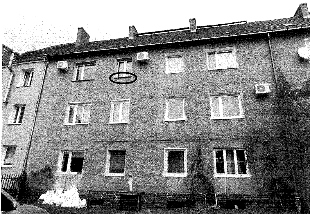
Fot.5. Widok od południa, oznaczono gniazdo wróbla.