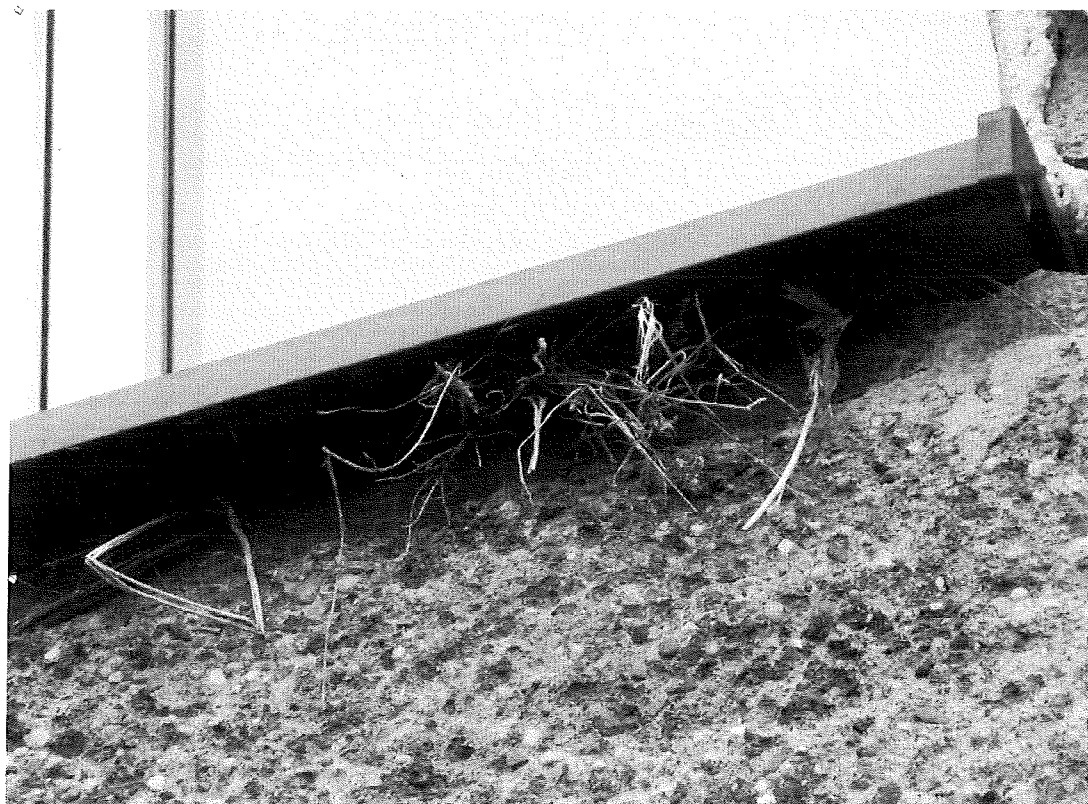
Fot.6. Gniazdo w zbliżeniu.