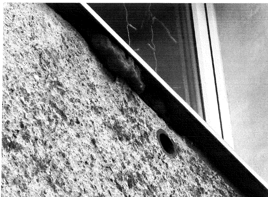
Fot.4. Otwór pod parapetem.