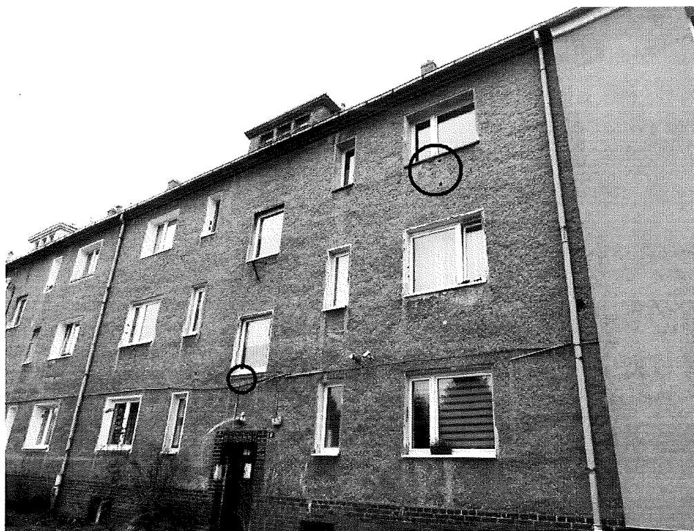
Fot.1. Ściana północna, oznaczono siedliska ptaków (aut. Szymon Wójcik).