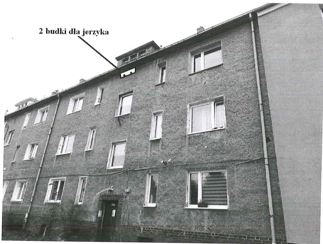
Fot.7. Zalecane miejsce montażu 2 budek dla jerzyka na ścianie północnej (aut. Szymon Wójcik).

Simprint Sp. z o.o. Al. Tadeusza Kościuszki 80/82 lok. 301 90-437 Łódź NIP: 725 224 16 52 simprint@onet.pl Kom. 609 888 003